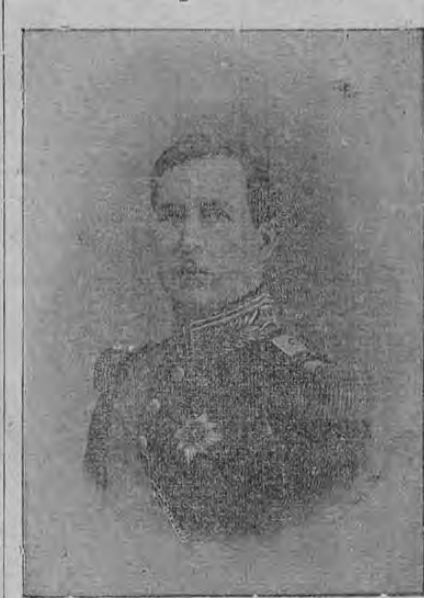
S. M. ALBERTO I