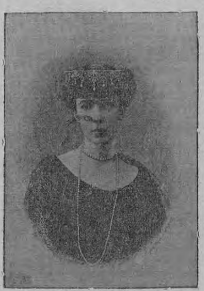
S. M. LA REINA ELIZABETH

Los soberanos de Bélgica figuran entre los más jóvenes de Europa. El Rey Alberto nació en Bruselas el 8 de abril de 1875; era hijo del Príncipe Felipe Eugenio, Conde de Flandes, hermano del Rey Leopoldo II y de la Princesa María de Hohenzollern.