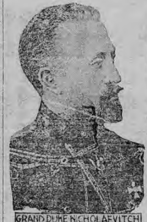
GRAND DUQUE NICHOLAEVITCH

GRAN DUQUE NICHOLAEVITCH hermano del Czar y Comandante en Jefe del Ejército ruso, quien ha salido personalmente a dirigir las operaciones contra Alemania. Tiene 57 años de edad y es Ayudante de Campo General, General de Caballería, Comandante de la Circunscripción de San Petersburgo y Presidente del Comité de Defensa Nacional.