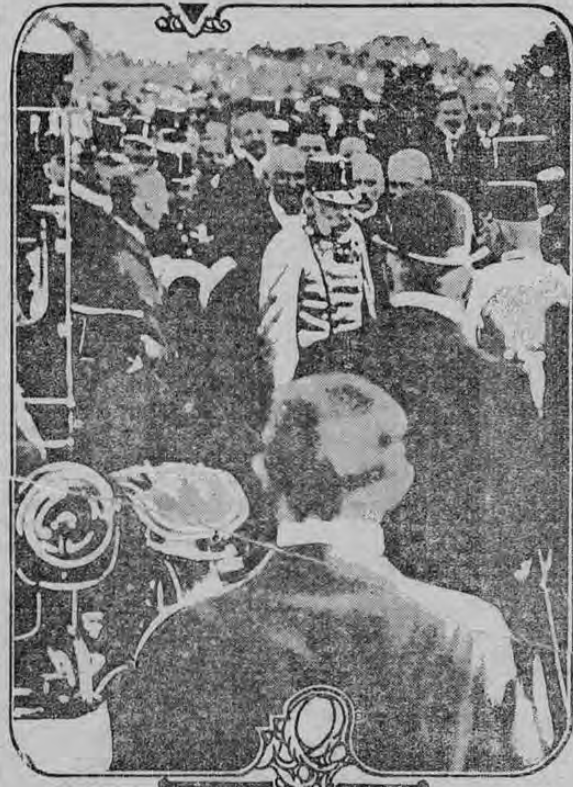
EMPEROR FRANCIS JOSEPH in VIENNA

Es la presente una de las últimas apariciones públicas del Emperador de Austria y Rey de Hungría, Francisco José, pocos días antes del asesinato del Archiduque Francisco Fernando, heredero a la corona imperial.