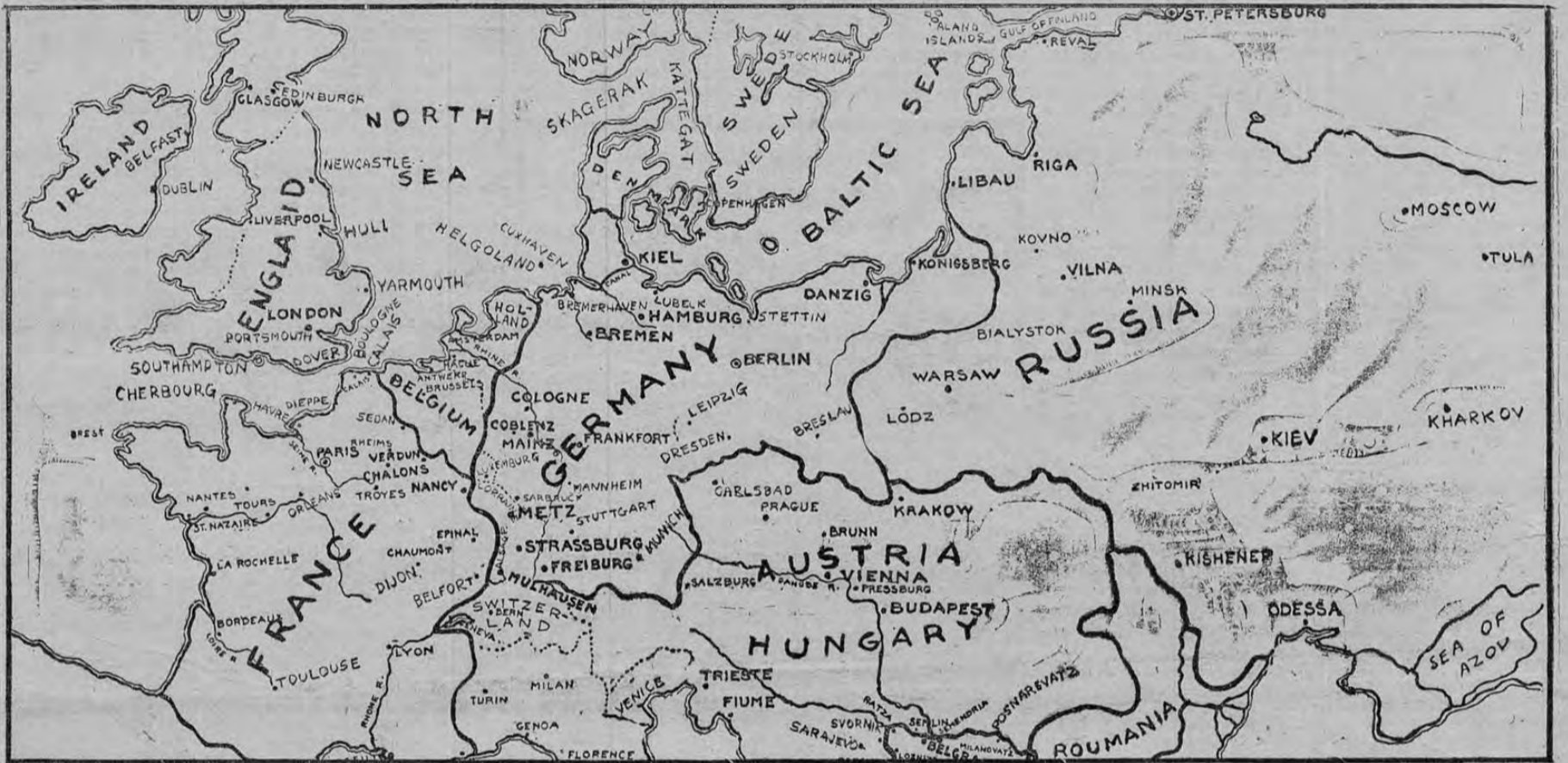
Al publicar el presente diseño del teatro actual de la guerra europea, procuramos ofrecer a nuestros lectores una rápida y clara visión de los inmensos territorios civilizados asolados por la lucha en que se liquidan todas las cuestiones de origen histórico y sociológico pendientes en las secciones más prósperas y más hermosas del Viejo Mundo. Obras de arte, progreso, humanitarismo, todo ha de sufrir en esta ocasión la cruel persecución de la guerra. El sacrificio sería menos sesado si, al menos, sobre las ruinas humeantes de 1914, pudiera levantarse para siempre y en base sólida el templo auguste de la paz.

NEW YORK.—El Teniente General Miles del ejército de los Estados Unidos al referirse